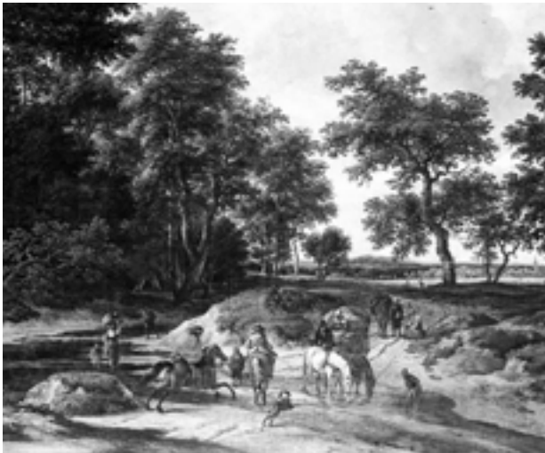
Lânskip mei in foarde by de râne fan in bosk, skildere troch Jacob Isaacksz. fan Ruisdael, 1650 -1682.

De minske siket himsels in wei. Net allinnich troch it libben, mar ek nei plakken dêr't er wêze wol. Yn alle iuwen dat ús lân bewenne is, ha der diken west. Hast allegear sille se ûntstien wêze troch kontinue minsklike betreding. It lânskip spilet dêrby in bepalende rol. De minske is noch net by steat om de natuer te bedimjen. Wis is it net altyd mooglik om de koartste wei te kiezen. Moerassige gebieten, steile hellings, bosken en sânferstowingen kinne it needsaaklik meitsje om in langere rûte te kiezen. In dyk troch de bosk moat makke en ûnderhâlden wurde, dat kin djoer en arbeidsyntinsyf wêze. In wei oer de heide is folle makliker; de no noch sichtbere karrenspoaren toane dat de reizger sels syn paad siket.